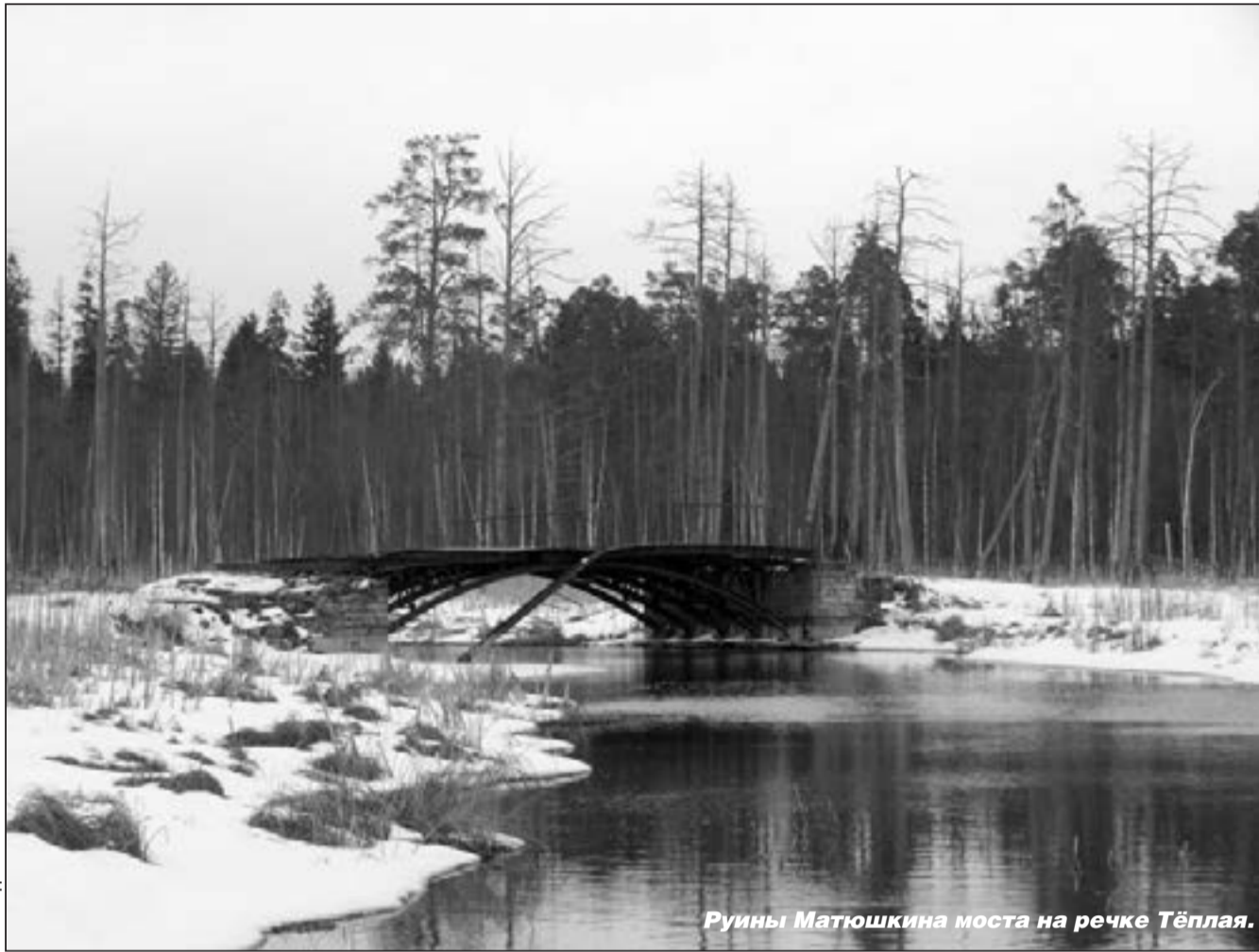
Руины Матюшкина моста на речке Тёплой.